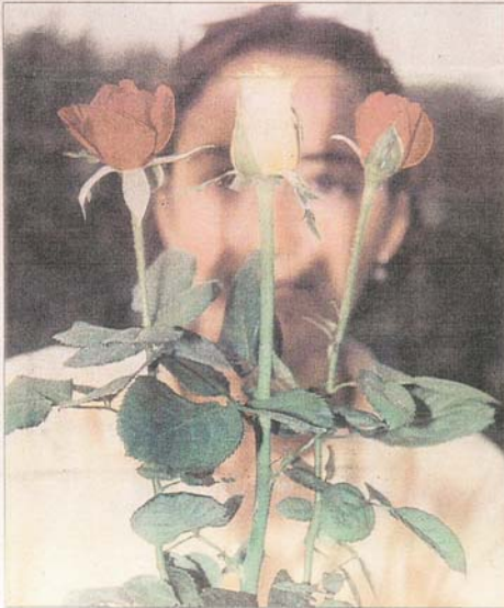
DAHA GÜZEL VE KALIN

Fransa örneği Topraksız tarım denilen pomza taşı, perlit, hindistancevizi veya pişmiş kil üzerinde yetiştirilen domates, bir dönümlük 42-48 ton ürün veriyor. Aynı uygulamaya ile dönüm başına 70 ton ürün alan Fransızlar bu rakamı 90 tona çıkararak için çalışıyor.